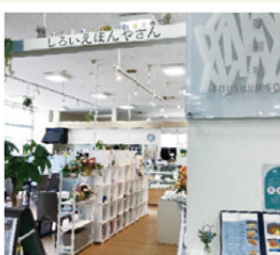
しろいえほんやさんを通して店内へ

まちで見つけた素敵なお店や場所、もの、人など情報をお伝えします。診療の帰りに寄ってみてくださいね。