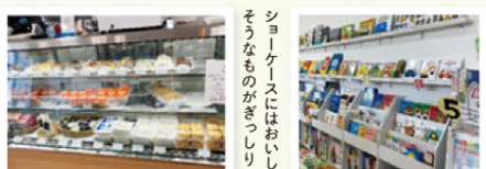
ショーケースにはおしいし そんなものがいっぱい